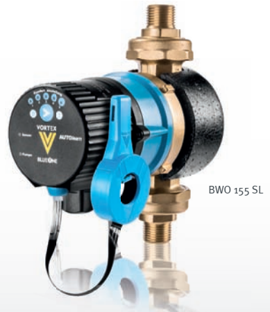
BWO 155 SL

Darüber hinaus passen die Pumpenmotoren auf alle markt-gängigen Pumpengehäuse!