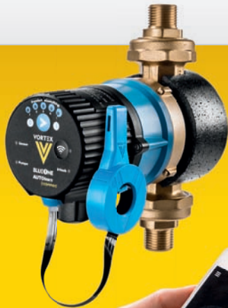
BWO 155 SL CONNECT